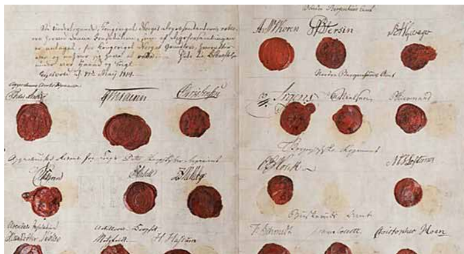
Segl og signaturar på Grunnlova.

Landet sitt verdigrunnlag står i § 2. I 1814 starta paragrafen slik: «Den evangelisk-lutterske Religion forbliver Statens offentlige Religion. De Indvaanere, der bekjende sig til den, ere forpligtede til at opdrage sine Børn i samme...».