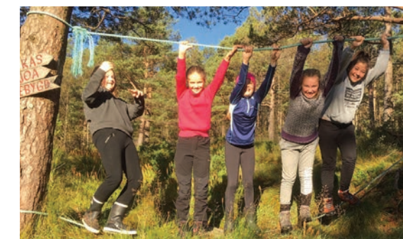
Turen til Vikestølen.