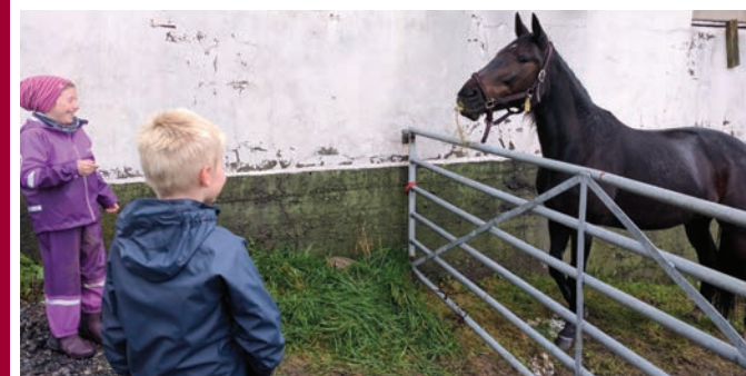
Trusopplæring på garden.