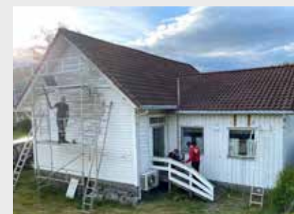
Bedehuset før og etter.