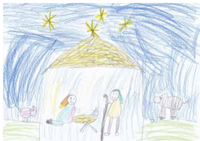
Mathilde Tjemsland, 1. klasse, Skjold Skule