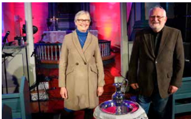
Foran: Dåpssettet (kanna frå 1872, kjøpt på antikvariat i Danmark).