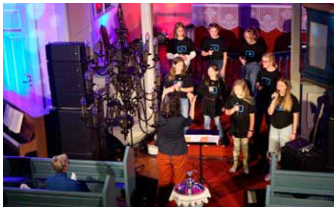
Vindafjord Soul Children.