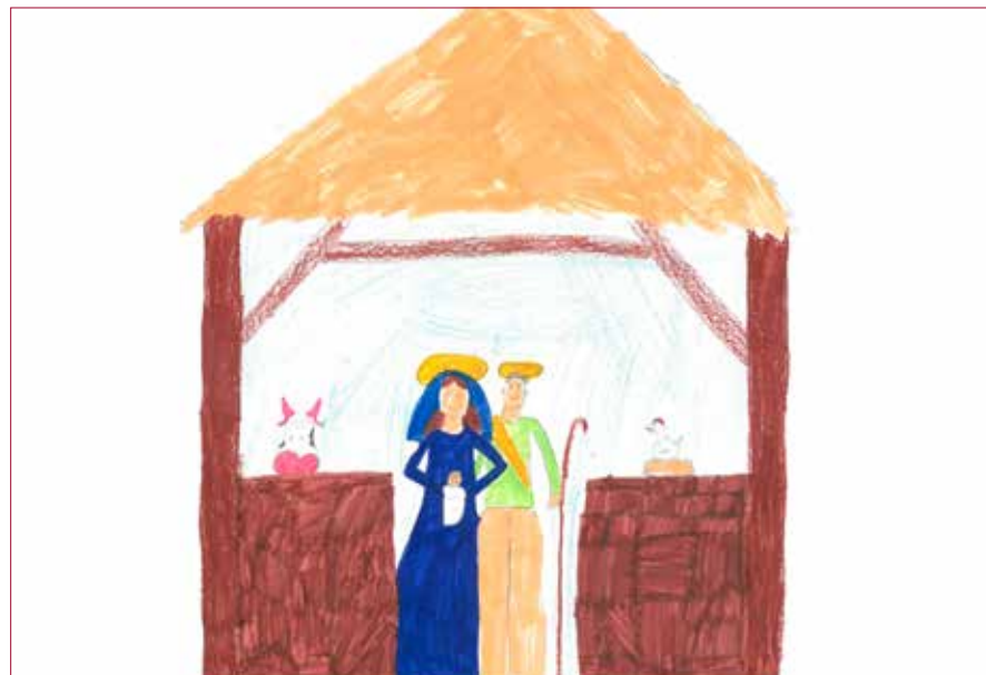
Teikna av elev på Imsland skule.