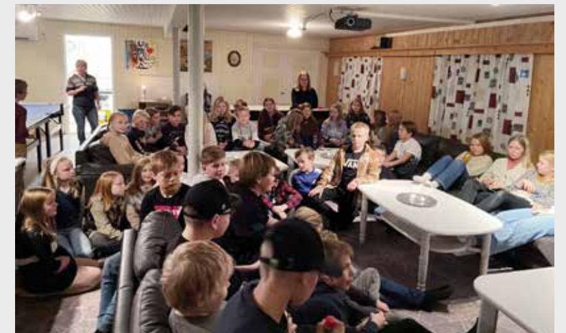
Trangt om plassen i bedehuskjellaren.

Det vart ein veldig fin kveld for oss alle som var på klubben i bedehuskjellaren i går. Alle, både vaksne og unge, hadde det kjekt i lag.