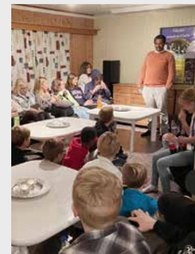
Ord for kvelden ved Tsegayesus.