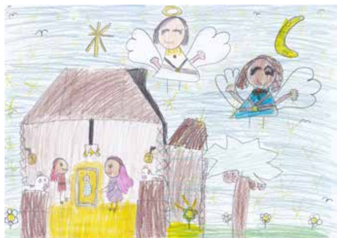
Odine Vaksvik, 3. klasse, Skjold Skule