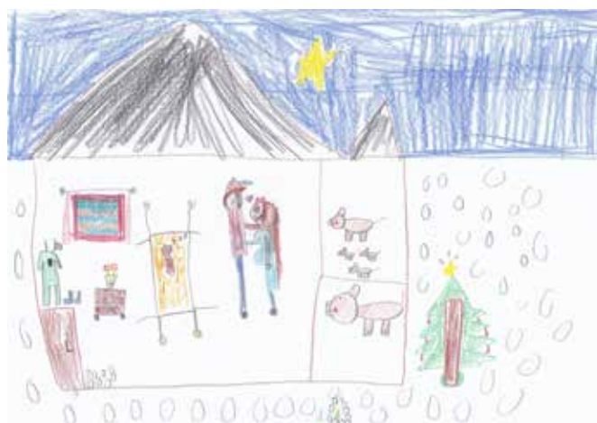
Selma Solheim Gangstø, 4. klasse, Bjoa Skule