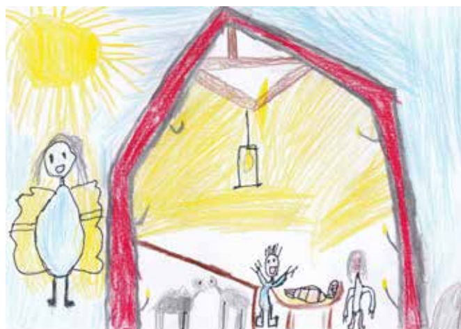
Jonas Maurangsnes, 3. klasse, Vik Skule