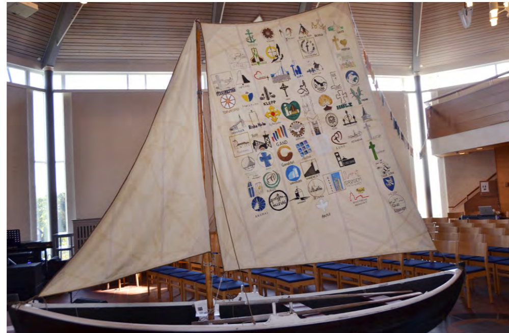
Stafettbåten var ei veke i Skjold kyrkje i september.

anna viktig å fortelja om kyrkja sitt sosiale engasjement i historie og notid, og å visa kva kyrkja og institusjonane betyr i samfunnet. «Saman» skal inspirera til å vera kyrkje i og for verda i dag: å halda fram med og også fornya det sosiale engasjementet i kyrkja.