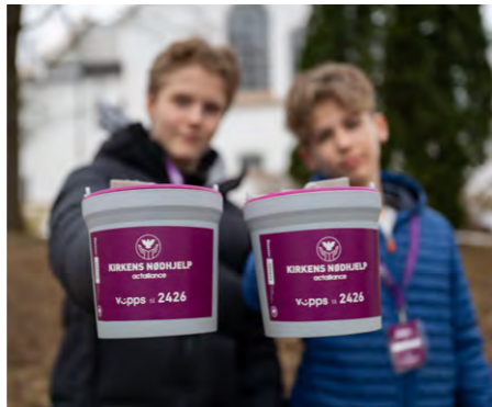
Bøsseberarar. VIPPS nr. 2426.

Zambia er eit av landa der Kirkens Nødhjelp er til stades, og hjelper med å redde liv, styrka motstandskraft og sikra rettferd. Det har vore tørke i