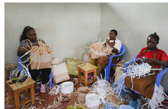
Damer i sving med veske-fletting. Dei er veldig populære i Noreg og går under namnet Life Bags. Alle pengane går direkte til dei flinke damene (som verkeleg treng pengane...)

elevgruppe med elevar med mor eller far frå Noreg og den andre forelderen frå Kenya, elevar med bakgrunn frå Etiopia, Somalia, Uganda og sjølv-sagt frå Noreg. No er elevflokket på skulen ein fin gjeng på 40 elevar. Skulen er fullteikna, og det er fleire elevar på ventelista. Pappa Egil arbeidar som assistent på skulen.