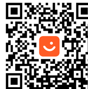
QR-kode til VIPPS Hyrdingen.

Redaksjonsarbeidet vert gjort som dugnad, men vi leiger tenester frå Omega 365 Design til layout, trykk hos Kai Hansen trykkeri og distribusjon i Posten. Rekneskapen blir ført av kommunen, og revidert av kommunen sin revisor (som del av Fellesrådet sin rekneskap). Seinare år har inntektene vore mindre enn kostnadane. Sokn og fellesråd har då bidratt med støtte for å dekke underskotet.