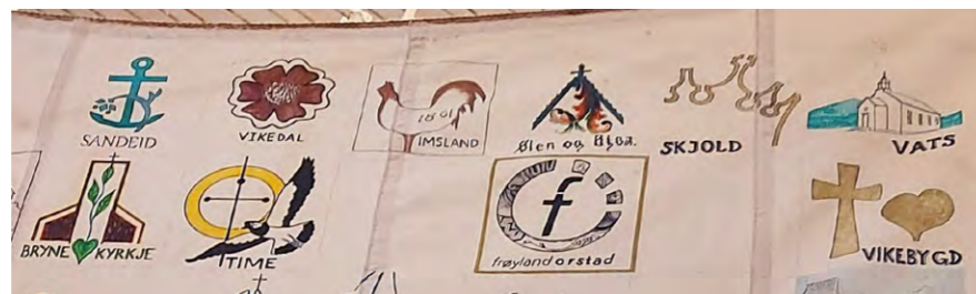
Eit «segl» frå kvart av kyrkjesokna.

Sjølv om jubileet har utgangspunkt i Stavanger og domkyrkjeplassen, vil det også merkast i Nordfylket. 7.-9. februar markerer Haugaland prosti jubileet, med festgudsteneste i Vår Frelsers kirke kor heile prostiet er inviterte. Dei ulike sokna er oppfordra til å ha sine markeringar utover i året, og i pinsehelga 6.-8. juni kan me seia 900x hurra og delta på mange arrangement i Stavanger by. Det blir stor jubileumsgudsteneste i domkyrkja 1.pinsedag, med mykje song og musikk.