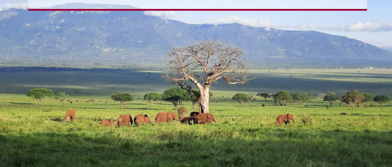
Elefantar i nasjonalparken i Tsavo.

helse- og hygiene, alfabetisering, styrking av born og kvinner sine rettigheter, teologisk utdanning og evangelisering, er dei med på å styrke menneska sine livsvilkår og gjera evangeliet kjent mellom fleire ulike folkegrupper i Kenya. Soknerådet for Skjold, Vats og Vikebygd har dette som sitt misjonsprosjekt.