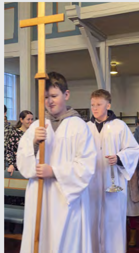
Konfirmantar på Bjoa.