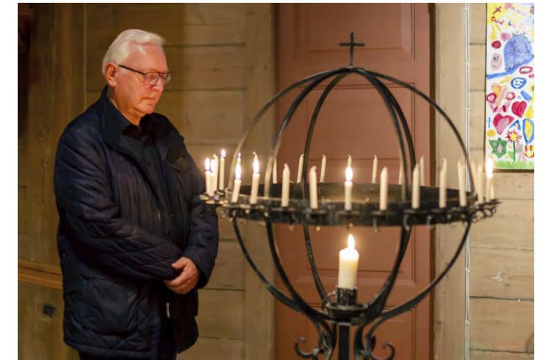
Bønn foran lysglobe.

Frigjer meg frå trongen til å koma med endelause utgreingar; gi tanken min vengjer, slik at eg kan koma til saka. Forsegl mine lepper om alle mine plager og skavankar. Dei aukar stadig, og det gjer også gleda ved å fortelja om dei for andre.