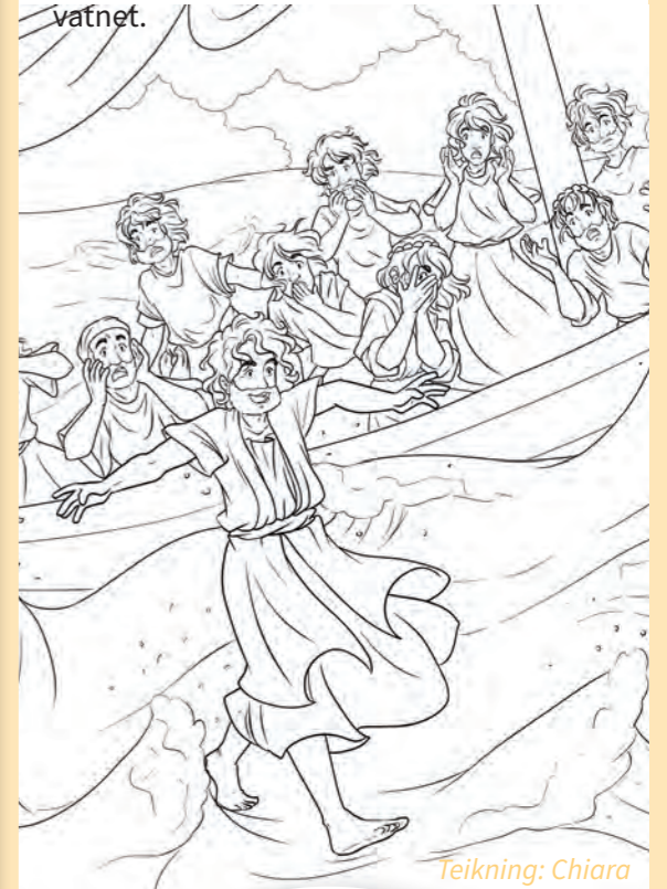
Teikning: Chiara Bertelli

Hugsar du bibelforteljinga om då Peter ville prøve å gå på vatnet slik som Jesus? Fargelegg biletet av Peter som går på vatnet.