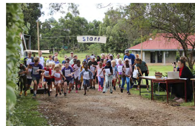
Heile skulen klar for Knirken-løpet (5 km løp som skulen arrangerer kvar vår).

Jobben som lærar på NCS er som andre lærarjobbar: å driva god undervisning og byggja gode relasjonar. Sidan me er ein såpass liten skule, har me gode moglegheiter for mange utflukter og arrangement. Høgdepunktet for våre eigne ungar dette skuleåret var leirskule med heile skulen (og foreldre) til kysten av Kenya på «all inclusive-hotell» ei lita veke. Då var det symjing som stod i fokus heile veka. Det er også enkelt å ha aktivitetar og undervisning ute då veret som regel er på vår side. I løpet av eit skuleår har me ganske mange arrangement der foreldra/familien er invitert, t.d. idrettsdag, innsamlingsdag, jul- og sommaravslutning, løp osv. Vårt mål er å vera gode vitne for Jesus gjennom handlingane våre som gode rollemodellar i livet til elevane våre.