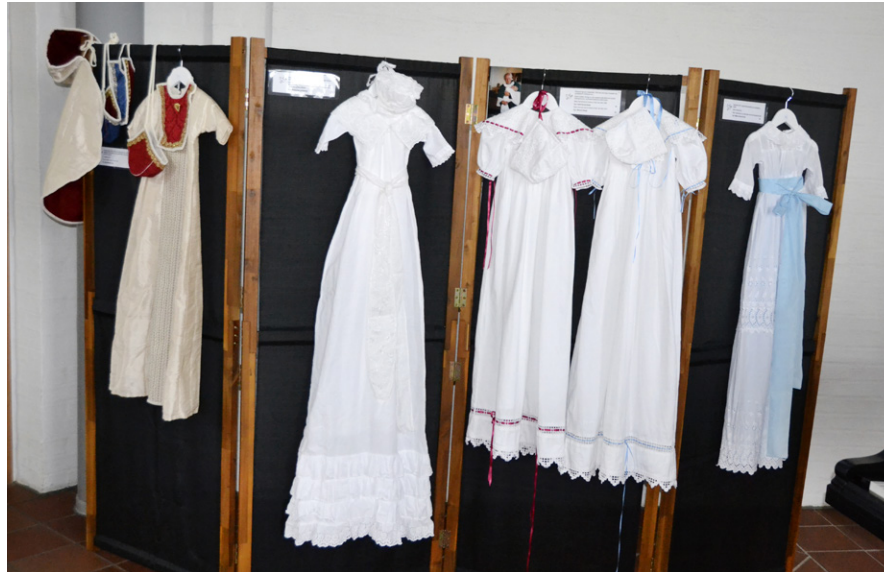
Mange fine dåpskjolar.

Frå 15. til 24. september var det dåpskjoleutstilling i Skjold kyrkje. Til saman 52 flotte dåpskjolar hang fint rundt om i kyrkja. Saman med kjolen var det faktaark, slik at ein kunne lesa historia om kvar einskild. Her var 100 år gamle kjolar, kjolar som 100 born var døypte i og kjolar som var så gamle og skjøre at dei var utstilte i ei glasramme. Det vart ei veke som gav tankar om kva dåpen eigentleg er, men som òg gav inspirasjon til m.a. dekking av bord til dåp, oppleve song og musikk knytt til dåp og barnetru, temakvelder, rusle rundt i fred og ro. Ei veke til ettertanke og glede.