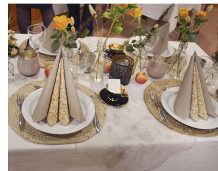
Fint pynta bord.

av utstillinga: konfirmasjon som stadfesting av dåpen.