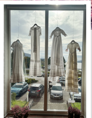
Dåpskjoleutstilling Sjå side 8